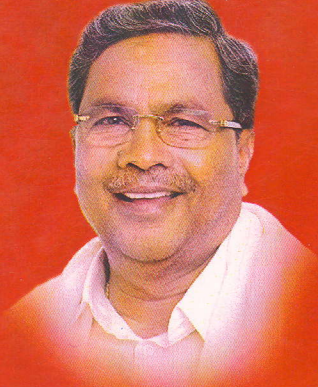
ಶ್ರೀ ಸಿದ್ದರಾಮಯ್ಯ ಸನ್ಮಾನ್ಯ ಮುಖ್ಯಮಂತ್ರಿಗಳು