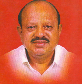
ಶ್ರೀ ಟಿ.ಬಿ. ಜಯಚಂದ್ರ ಮಾನ್ಯ ಕಾನೂನು ಮತ್ತು ಸಂಸದೀಯ ವ್ಯವಹಾರಗಳು, ಪುನಃಸಂಗೋಪನ ಸಚಿವರು